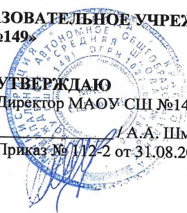
График работы социального педагога МАОУ СШ № 149 на 2023-2024 учебный год